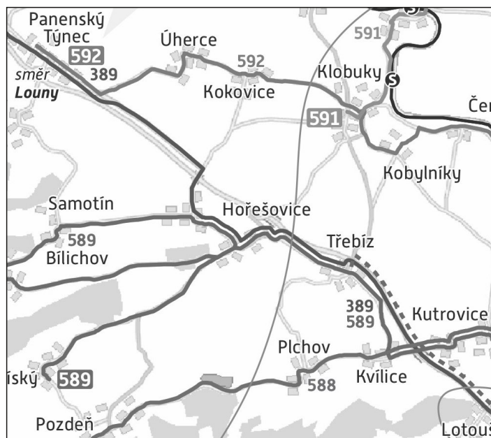
Schéma nových linek autobusů IDSK:

PLATBY STOČNÉHO čtvrtletně 300,-Kč/os na účet č.: 35-0389080319/0800 variabilní symbol = č.p.