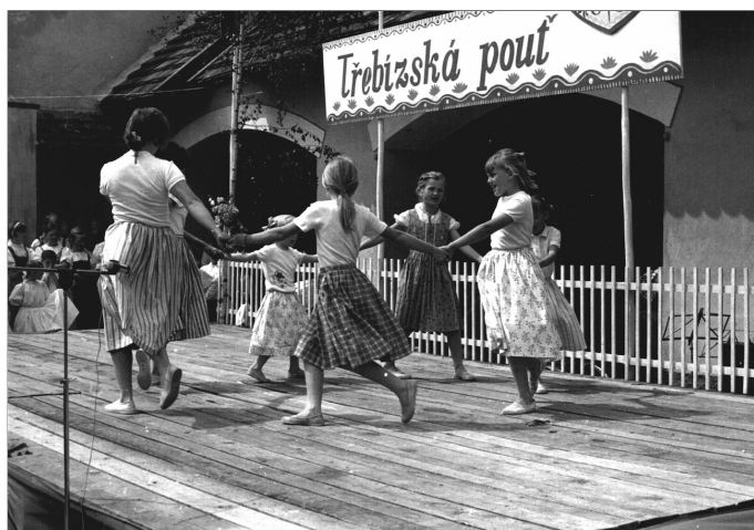
Foklorní vystoupení v č. p. 1 (soubor Klubičko z Třebíze, 1976)