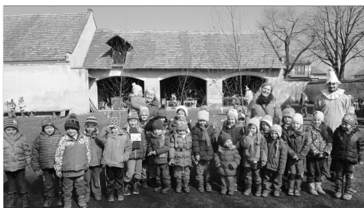
Velikonoce na statku, děti z MŠ Třebíz

Jaro je tady a s ním plno práce na polích i zahradách. Neměli bychom zapomenout také na malý jarní úklid nejen před svými domy, ale v celé obci a nejbližším okolí. Třebíz se letos přihlásila k akci „Uklidme Česko“ a proto, kdo můžete, přijďte v sobotu 16. dubna dopoledne chvíli uklízet a upravovat náves, parčík kolem pomníku V. B. Třebízského, dětské hřiště nebo posbírat poházené smetí a odpadky. Podél silnic nám letos pomohli brigádníci SÚS, kteří o víkendu 2.–3. 4. viditelně zapracovali.